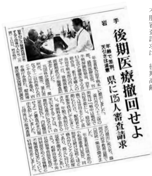
不服審査請求を報道した記事(9/13)