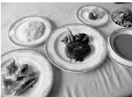
短角牛ハンバーグセット(1500円)、スープ、サラダ、前菜、ライス、デザート(濃厚な自家製チーズケーキ)、コーヒー

団体定期保険2008年度分配当金を4月10日に還付致しましたのでご案内致します。2008年度岩手グループ保険の配当率は6.78%、同じく東北グループ保険の配当率は29.49%となりました。還付先口座は、原則ご契約者様の当該制度保険料振替口座となっております。還付金額等詳細につきましては同封の個別明細をご確認下さい。なお、配当金より2008年度第10回常任理事会にて決定致しました15%の事務手数料を個別明細金額より控除して還付致しましたことをご了承下さい。なお、還付の際の送金手数料は協会負担と致しました。ご不明な点がございましたら事務局までお問い合わせ下さいますよう宜しくお願い致します。