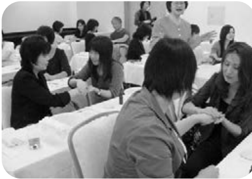
トリートメントの練習

また、実際に自分の好きな香りをリサーチし、洗面器にお湯を張った中に、好きな香りの精油を落として、目を閉じて香りを深く吸い込む「拡散」、タオルをお湯につけて絞る、きつく絞って首の後ろに当てる「温湿布」、「手浴」などを体験しました。 その後、2人組になつて、アロマオイルトリートメントを行いました。ラベンダーやローズ、いろいろな香りです。参加者は温湿布やトリートメントで癒され、自分専用のアロマオイルをお土産として持ち帰りました。