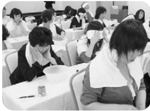
温湿布でリラックス

ピーツレタにしてスープにしました。見た目も鮮やかなピンク色のスープが完成しました。 サラダにはあま〜い桃とさつと茹でたキャベツをあつさりとしたソースで和えていただきました。 今回はお子さんの参加もあり、皿洗いなどを手伝いながら楽しく料理をし、参加者全員でおいしく試食しました。