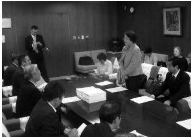
署名を副知事に渡し、要請する新婦人会長

第8次改善計画が見送りとなっ ており、この動向も見て対応 したい。④学校の耐震化につ いては、国の予算が40%増、 県は70%増、56億8000万 円となっている。市町村にも 小中学校の耐震化をできるだ け進めるよう求めている。⑤ 学校給食については、食育、 地産地消を重視して取り組む ようにしている。食材ベース の地産地消の活用は、34・5% で東北で1位、全国平均の23% を大きく上回っていると回 答しました。