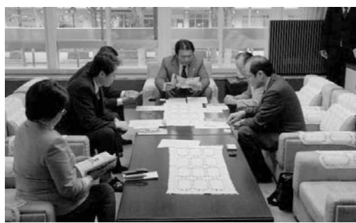
佐々木一榮県議会議長(正面奥)に要請

※会員の先生方にはリーフレットをお送りしております。 一般の方も対象の研究会ですので、多くの方にお知らせ いただければ幸いです。