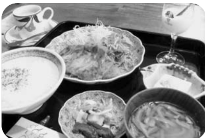
やまと豚ステーキ御膳 (1,470円) (やまと豚ステーキ・みそ漬、ひつまみ汁、地元商店街のお豆腐やさんの冷奴、香の物、地元野菜と八木澤商店のきゅうりのたまり漬、デザート、コーヒー)

沼宮内に昔懐かしい蔵を改装したレストランがあります。オーナーの柴田和子さんは家が肥料屋だったことで、幼い頃から農家の大変な状況を身近に見てきたことから、農産物を少しでも無駄にせず、地産物にこだわりたいという思いで、地産地消レストラン「らく丸」を始めました。 80%以上が岩手産にこだわったメニュー。一押しは「やまと豚のステーキ御膳(和風だれ・みそ漬)」です。ハーブと海藻入り飼料で愛情深く育てられたやまと豚はミネラルとビタミンたっぷり、驚くほど柔らかく、ジューシーで、脂身もあつさりとしています。岩手町大森商店の熟成みそで漬けたお肉はさらに旨みを増し、口に含むとふわっとみその香りが鼻から抜けます。ご飯は岩手町産有機米いわてっこ。具沢山のひつまみはもちもち、ツルツルで懐かしい味。デザートのくずまき