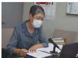
発言する小野寺女性部長

応募作品やサンプル動画はYouTubeで公開しています。応募要項など詳細は保団連のホームページをご覧ください。