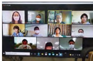
ZOOMで省庁担当者へ要請