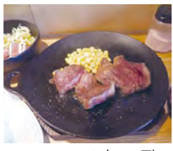
MARU3 ランチ (1550円)

ストビーサラダ、ご飯みそ汁、デザート、コーヒが付くお得なランチです。柔らかなモモ肉を使った自家製ローストビーフは牛肉のうまみが凝縮されています。ステーキは南部鉄器でレアに焼き上げられ、ふつくらジュシー。牛本来のうまみに岩塩をプラスしていただきます(ソースは6つの中から選べます)。臭みが全くなく、脂身もあっさりとしていてペロリと食べられるのは、豊かな自然の中で牧草主体で育てられた「グラスフェッドビーフ」だから。うまみが強く、やわらかな赤身肉を厳選して仕入れています。お肉が食べたくなった