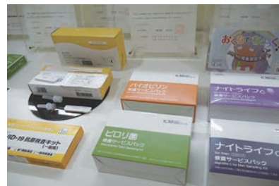
セルスペクトの検査キット。奥は製造等の許可証や登録証

検査キット開発への挑戦とこだわり 2020年2月、連日横浜の豪華客船で未知の感染症の拡大が報じられる中、同年4月、長崎に停泊したクルーズ船でも感染が発覚。調査・研究に協力する研究所がなく、セルスペクトが長崎大学と協力し現地で臨床症例研究を行いました。得たデータを元に、検査キットを開発し、薬事承認申請しました。