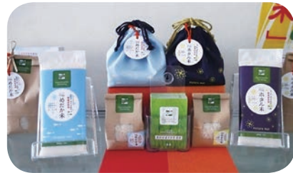
門崎ファームのお米 左側がめだか米、右側がホタル米

米農家としての「こだわり」と誇り、そして環境を守ることへの思いの感じられる温かい場所です。