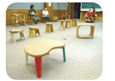
そらまめテーブルといす (いすの高さは使う人に合わせて作ります)