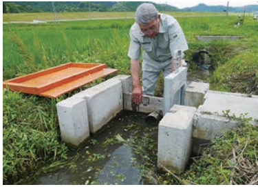
セキ上げ工と往来工。セキ上げ工で水をせき止めている