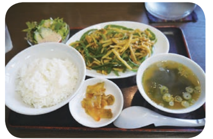
チンジャオロースー定食

道の駅かわさきから3分ほど車を走らせると、一面に広がる田んぼと共に、地元の方に評判の街中華が見えてきます。このお店では夏季特集でお伝えした「門崎めだか米」を使用しています。ランチはAからCの3種類、価格はどれも880円。ザーサイやチンジャオロースーに惹かれ、この日はCランチのチンジャオロースー定食(880円)と餃子(420円)を注文しました。