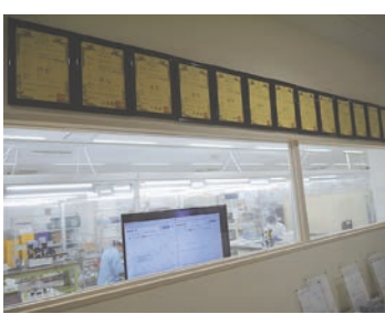
工場内とその上に並ぶ特許証

駆除・廃棄されます。北三陸ファクトリーでは、北海道大学と協力し、痩せウニを美味しいウニとして商品に変える活動も行っています。プラスチックからタイヤまで何でも食べる雑食性のウニを養殖するのは容易ではなく、約6年かけて養殖方法を確立。昨年には再生したウニを「はぐくむうに」として初出荷しました。また、