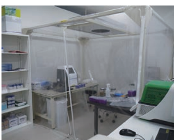
検体検査を実施する場所