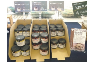
様々な加工品も販売されています