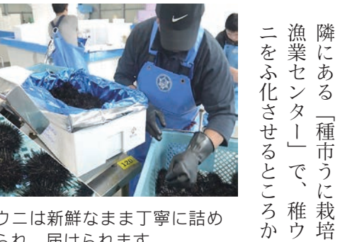
ウニは新鮮なまま丁寧に詰められ、届けられます

海の問題を見つめる 近年、「磯焼け」が問題となつていきます。磯焼けが起きると海藻がなくなり、餌不足で痩せて実入りが悪くなったウニは