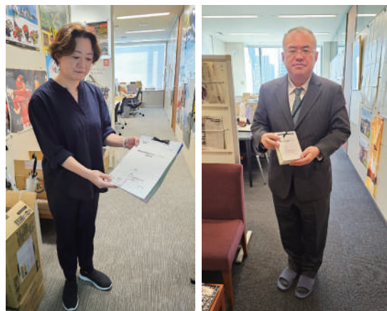
受け取った署名を渡す横沢高徳議員秘書(左)と小沢一郎議員秘書(右)

現を目指す決議」を紹介し、「保険証廃止」に絞った問題提起をする意見を発表する予定であることを報告しました。日弁連と保団連でこの問題に対する考え方が一致しているとし、意見書は今後、日弁連、保団連の運動にとって大きな武器になると締めくくりました。