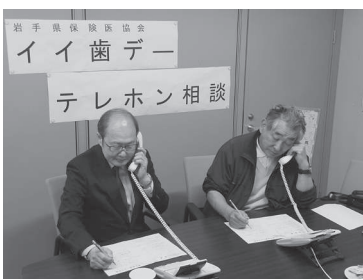
テレホン相談のようす

でした。具体的には「2年前に義歯を新製した。調整しながら使っているが、ご自身の希望や質問を主治医にお話しできない様子が目撃されました。担当役員は相談者の話を伺い、追加の訴えや相談内容を深く掘り下げ、問題点を整理し懇切丁寧に回答しました。主治医にどのような話をしたら良いかわからない相談者には、今回の相談の回答内容を整理して主治医へ伝えるなど、お話しするうえでポイントを伝えました。また、予約や初診時に受付に伝えるべきポイントが残していきたいがどのようになりたいか」「歯ぎしりがひどく、睡眠時無呼吸症候群もあるため、数年前にマウスピースを作製したが合わなくなってきたのでどうしたら良いか」「普段から顎やこめかみの部分に痛みが原因は何か」など相談内容は多岐に渡りました。