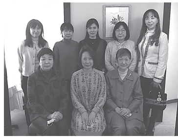
おいしい料理を堪能

3月3日、盛岡のフレンドレストラン「シェムラブル・リス」で女性医師・歯科医師を対象にひなまつりランチ交流会を行いました。女性部主催の交流会は、コロナ禍もあり4年ぶりの開催で、7名の先生が参加しました。