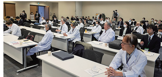
63名が現地参加した国会内集会