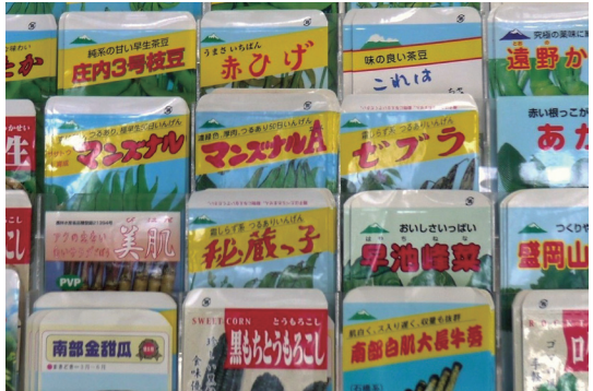
オリジナル品種と伝統野菜の種子

社のうち、種苗開発・生産を主体としているのは5%ほど。近年は、国内の採種農家の減少で苦勞しています。そこで、生産地を海外に求める動きもあります。特