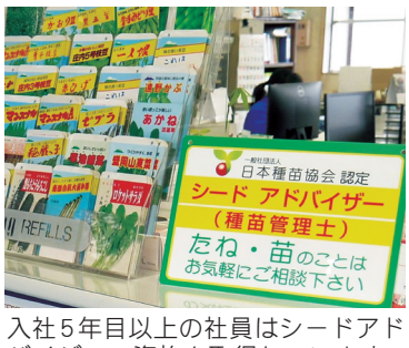
入社5年目以上の社員はシードアドバイザーの資格を取得しています。

半分に減少し、値崩れを防ぐため飼料への転作や畑地への変更も行われています。コメ農家の高齢化とともに担い手が不足し、生産量不足になる恐れがないわけではありませ